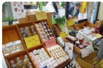
野菜・米や漬物などを販売 生産者による焼き栗実演