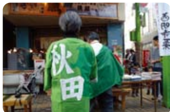
「秋田」のハッピーを着た販売者