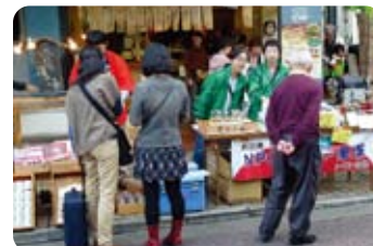
消費者と生産者の交流風景