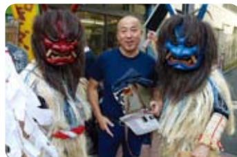
秋田県東京事務所職員による 「なまはげ」のデモンストレーション